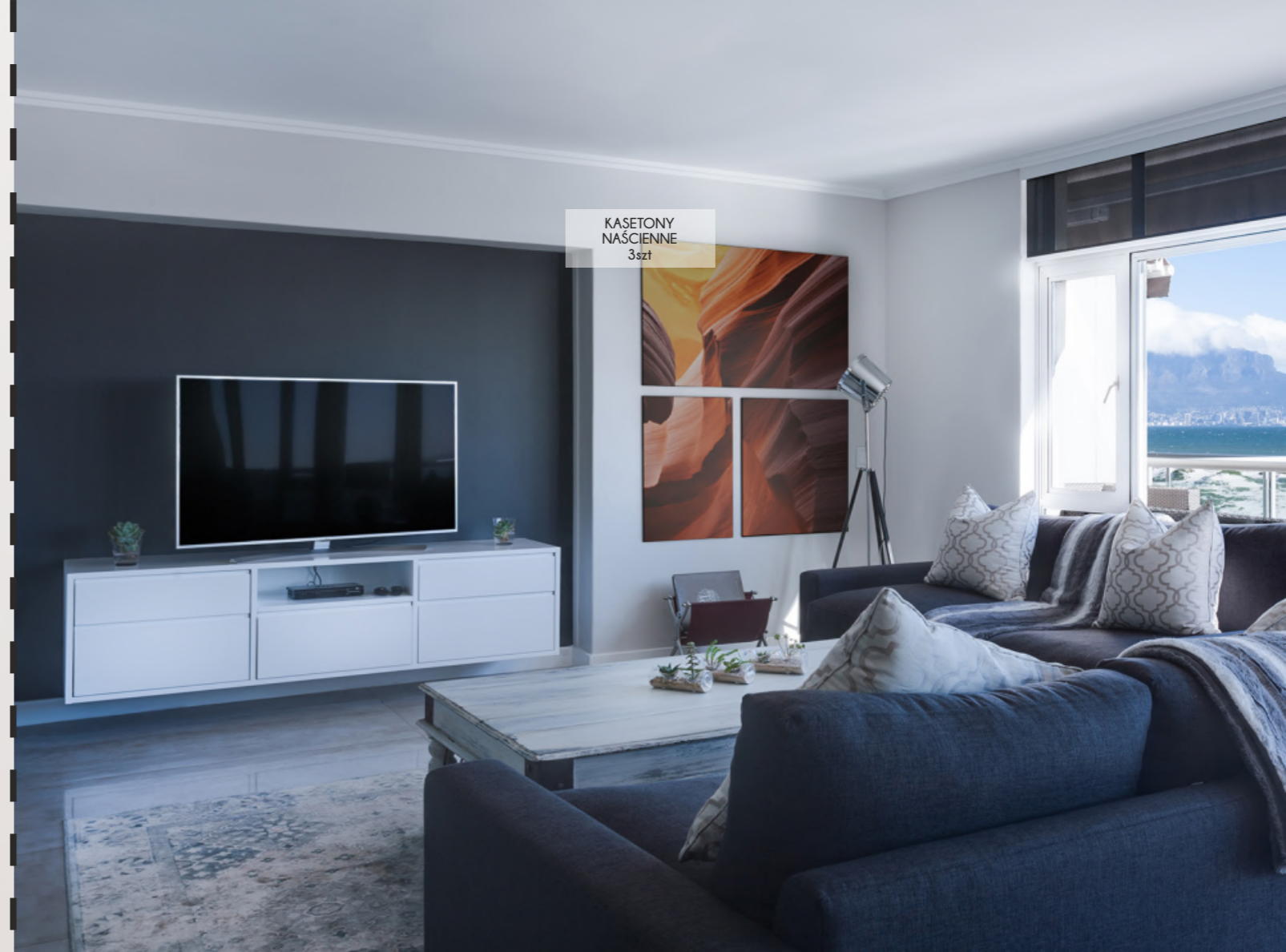
KASETONY NAŚCIENNE 3szt