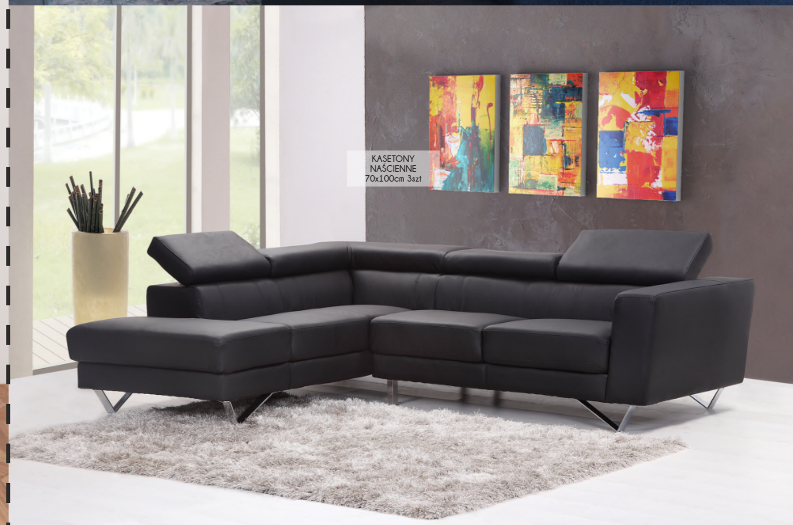
KASETONY NAŚCIENNE 70x100cm 3szt